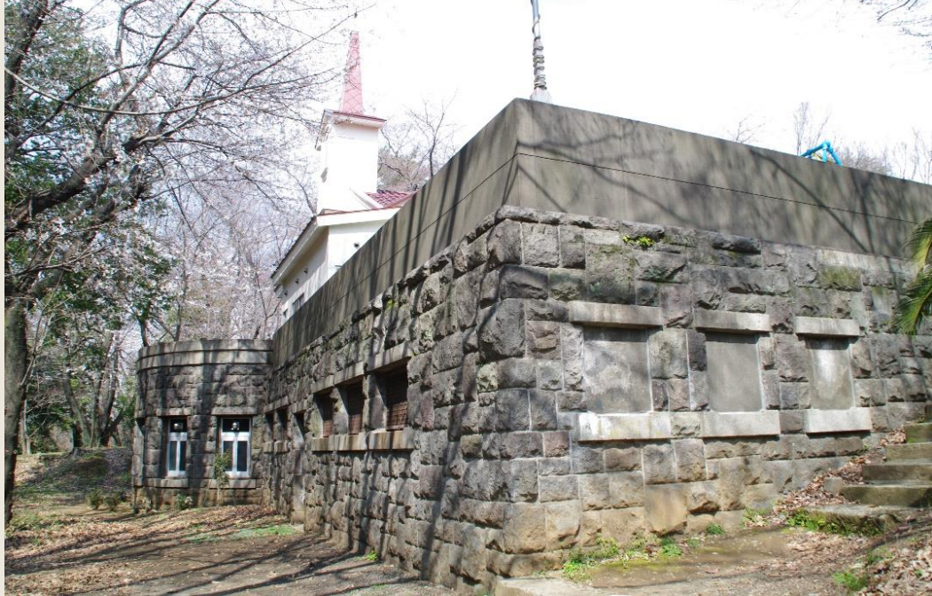
将校会議室跡（現戸山教会）