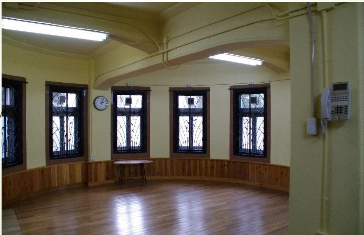
将校会議室跡（内部）