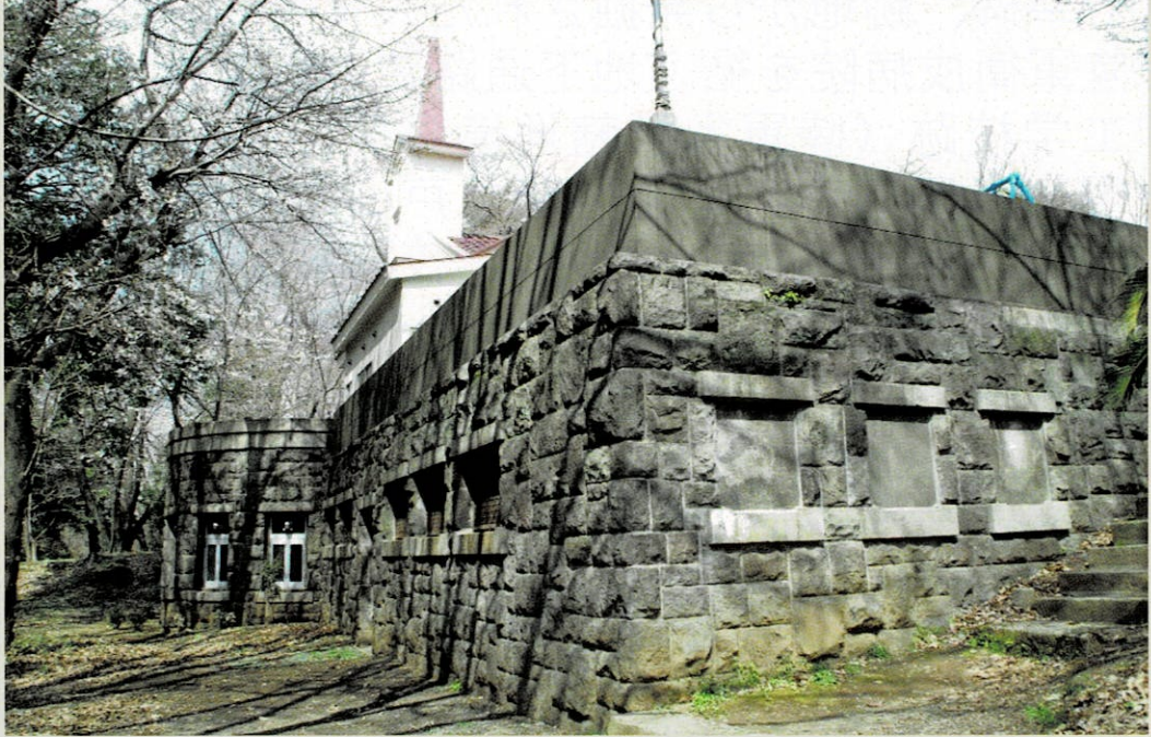
将校会議室跡 (現戸山協会)