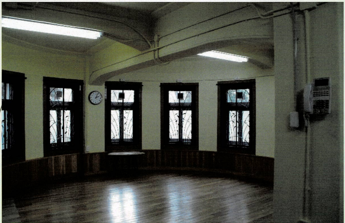
将校会議室跡（内部）